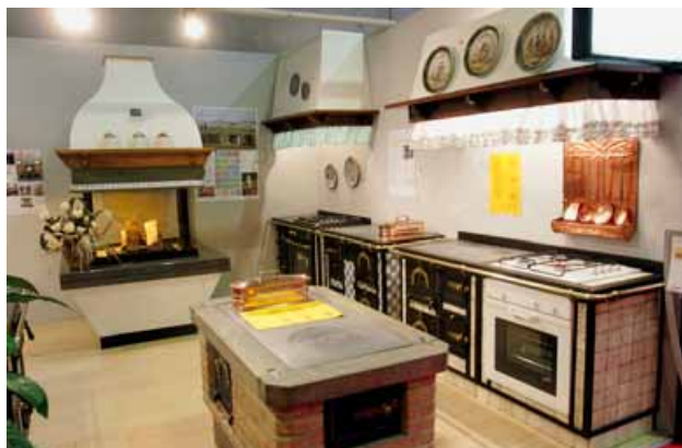
Progetto Fuoco si tiene ogni due anni. La prossima edizione si terrà, dunque, nel 2010, sempre a Verona

Chi visita Progetto Fuoco trova le più importanti ditte dei seguenti settori: caminetti, focolari tradizionali; rivestimenti per caminetto; inserti per caminetto in acciaio, ghisa; termocamini ad aria, termocamini ad acqua; stufe a pellet in acciaio, ghisa, ceramica, maiolica, pietra naturale; stufe a legna in acciaio, ghisa, ceramica, maiolica, pietra naturale;