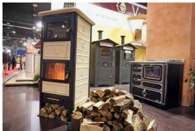
Sono in mostra oltre 220 tra stufe, caminetti, caldaie e termocucine, tutte funzionanti grazie allo speciale impianto di aspirazione dei fumi

stufe ad accumulo termico in ceramica, maiolica, pietra naturale; cucine a legna, forni a legna, termocucine; barbecue; cucine in muratura; caldaie a pellet, cippato di legna; caldaie a legna pezzata; caldaie a biomasse; comignoli e camini in refrattario, acciaio; materiali refrattari; maioliche, ceramiche; servizi di fumisteria, ecc.