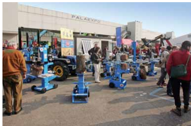
Grande spazio è stato dato anche a spaccalegna, cippatrici e macchine per produrre pellet

Chi ha intenzione di acquistare uno dei prodotti sopra citati non può non visitare Progetto Fuoco perché qui nello stesso