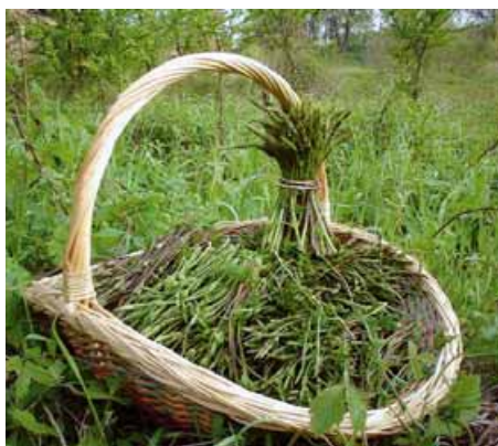
Dal 9 all'11 maggio si svolge, a Berra (Ferrara), la «Sagra del bruscandolo» (luppolo) giunta quest'anno alla 6ª edizione

prire il bruscandolo (luppolo) e di riproporlo per valorizzare le nostre tradizioni culinarie e riscoprire i sapori genuini di un tempo.