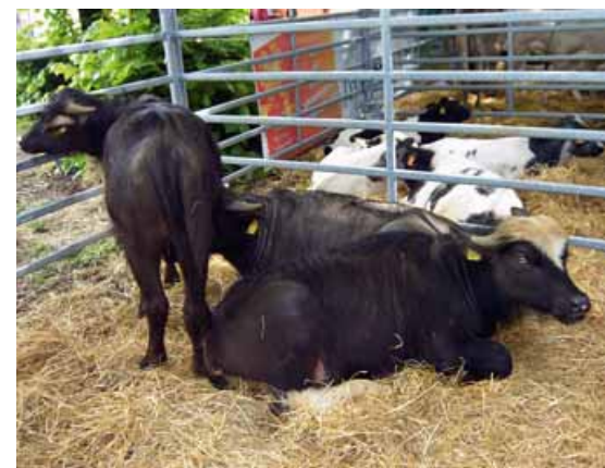
Domenica 18 maggio si svolge, ad Olgiate Comasco (Como), «Natura in fiera», Mostra agrozootecnica a misura di bambino