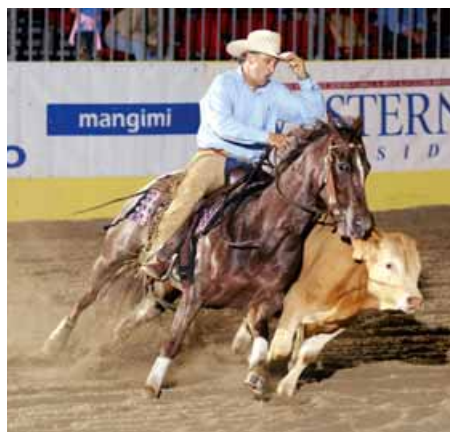
Al «Salone del Cavallo Americano», in programma dal 15 al 18 maggio a Reggio Emilia, è possibile assistere a molti spettacoli

Orario di apertura al pubblico: dal 27 aprile al 20 maggio il Giardino dell'Iris resta aperto dalle ore 10 alle 12,30 e dalle ore 15 alle 19.